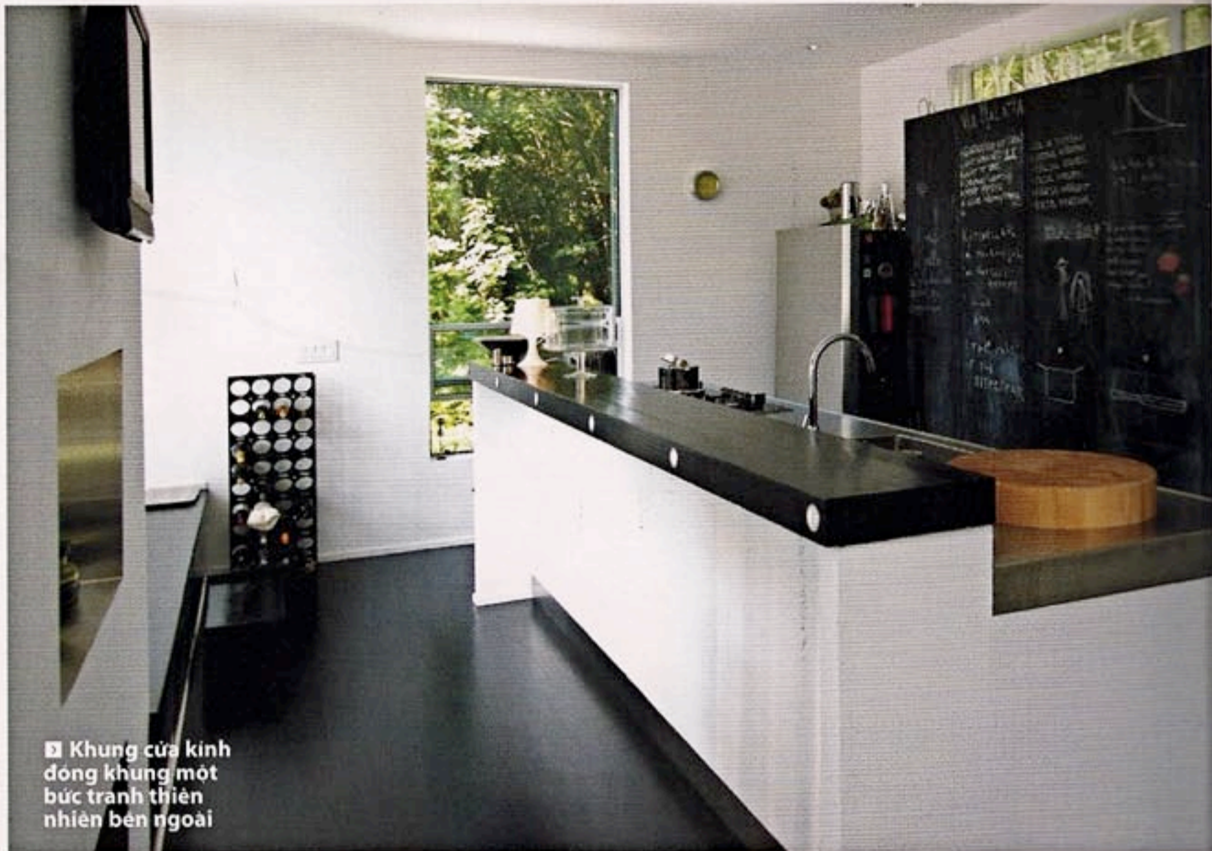
▣ Khung cửa kính đóng khung một bức tranh thiên nhiên bên ngoài